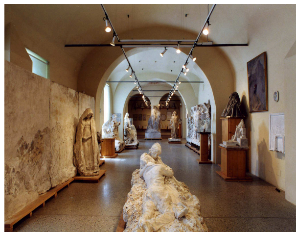
Gipsoteca L. Bistolfi

Museo Civico e Gipsoteca Leonardo Bistolfi via Cavour 5, Casale Monferrato cultura@comune.casale-monferrato.al.it www.comune.casale-monferrato.al.it (sezione cultura)