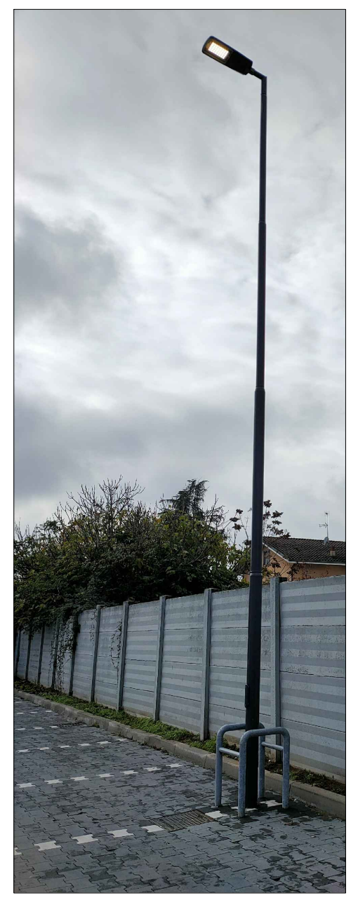
DETTAGLIO palo per illuminazione pubblica scala 1:50