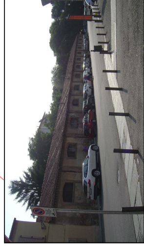
Basso Fabbricato ex Scuderie lato sud Via Leardi