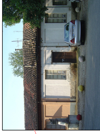
Basso Fabbricato ex Scuderie lato cortile interno