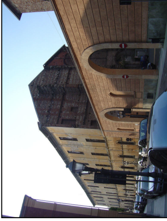
Fronte Via Cavour