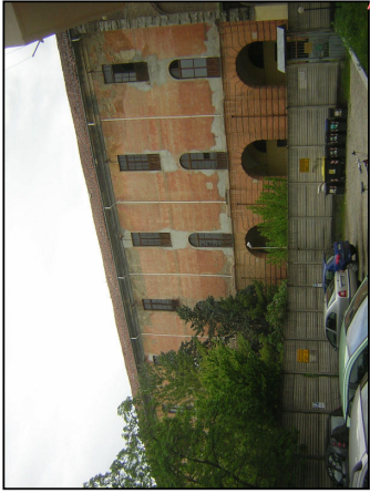
cortile interno fronte sud