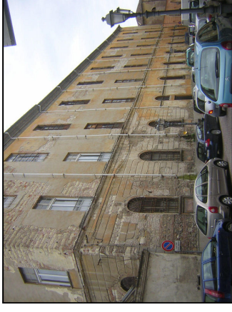
Fronte Via Cavour