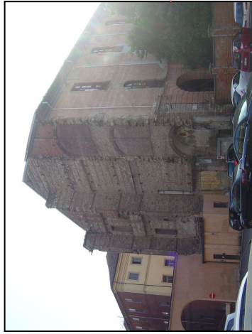
Area parcheggio pubblico Fronte ovest