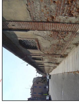
Basso Fabbricato ex Scuderie lato sud Via Leardi