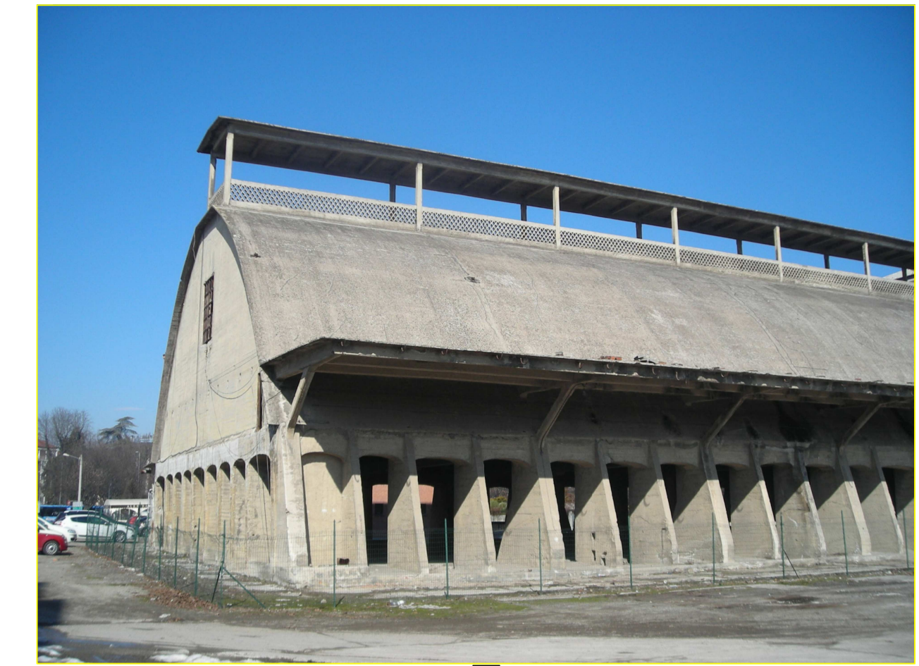
1. vista da Via Padre Pio da Pietrelcina