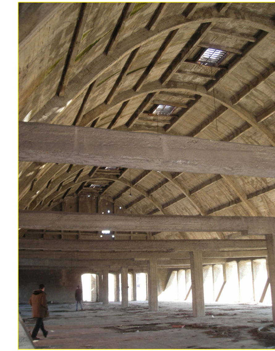
2. vista dell'interno